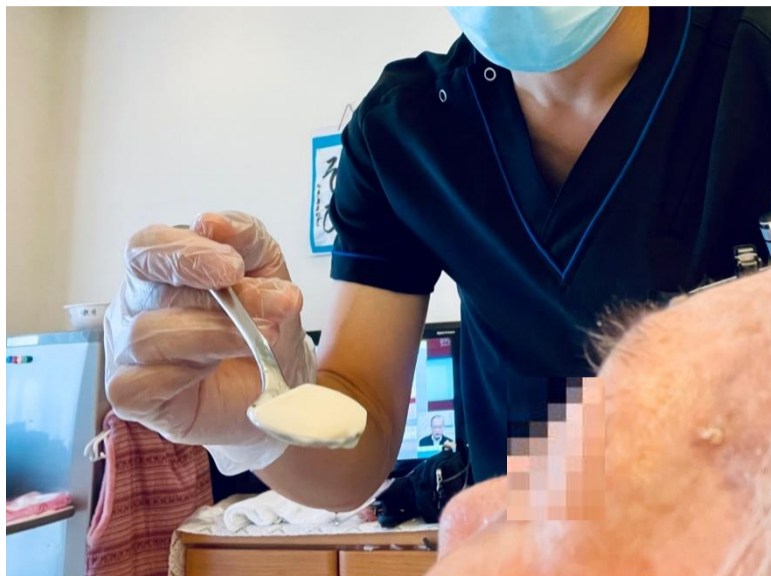
写真＝言語聴覚士による嚥下リハビリテーションの様子(9月5日) 本日はプリンを召し上がられています。

ロイヤルホームでは言語聴覚士によるリハビリテーションをご提供しています。中でも嚥下リハビリテーションの需要は高く、ご本人様やご家族様の食事への期待が大きく、やりがいにつながっています。その一方で、ロイヤルホームでできる限界もはっきりしていますので、ご入居者様のご状態に合わせて進めています。