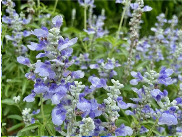
写真= 4F庭園 サルビア (2022年8月25日)