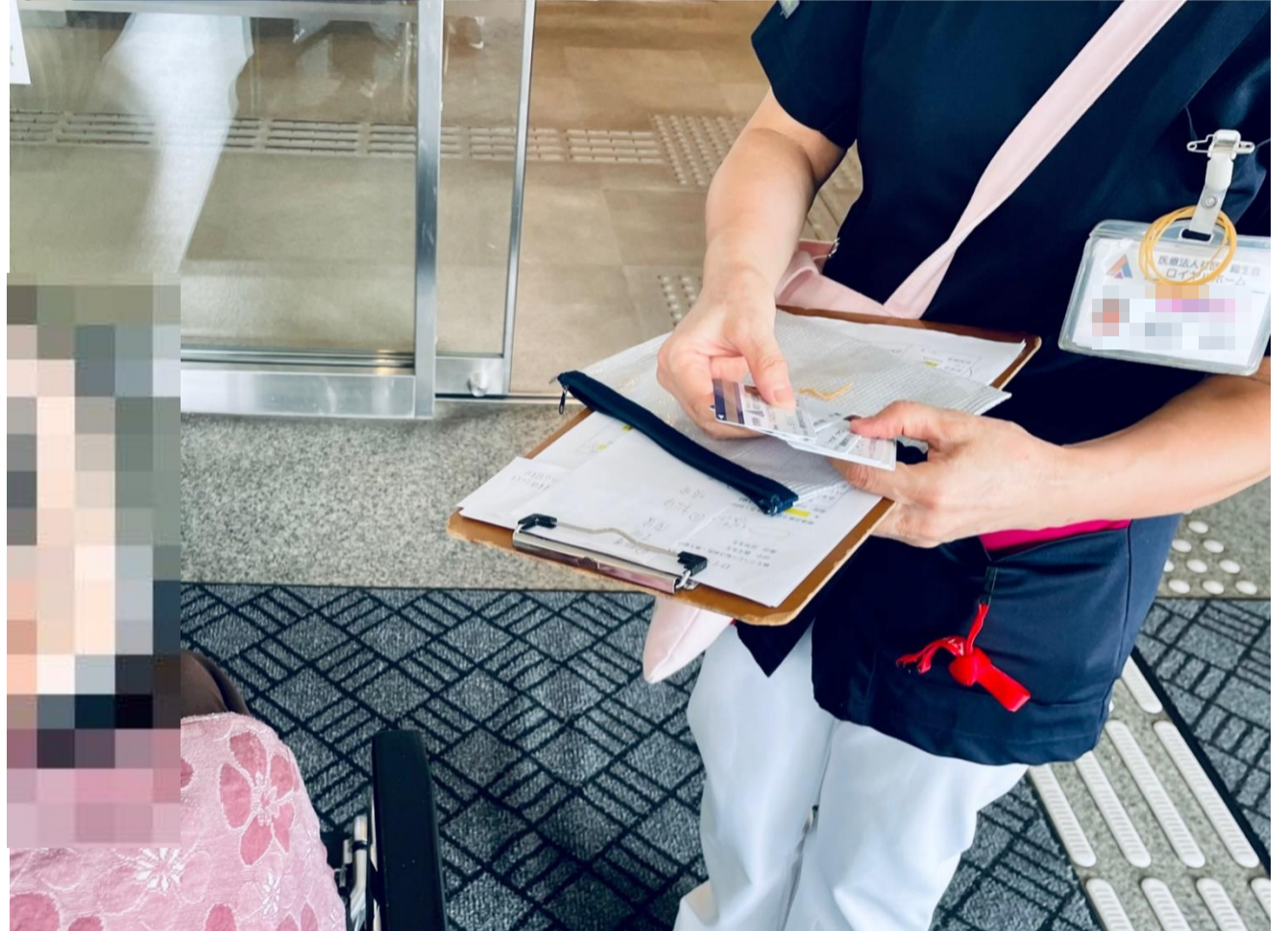
写真= 心電図、胸部x-pの為リハビリ総合病院にて(2022年 9月 9日 )