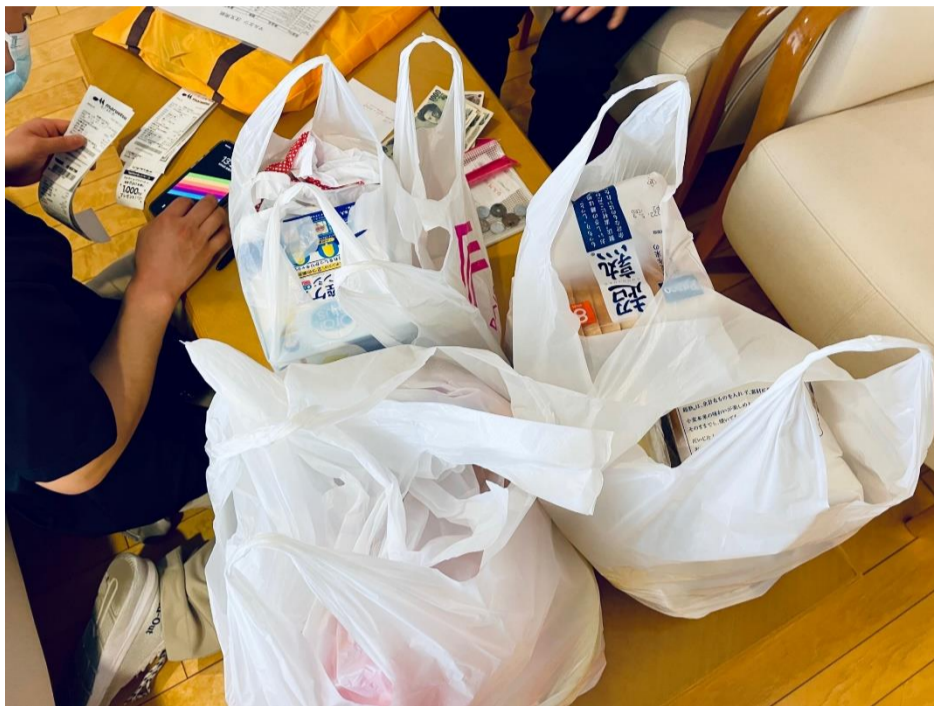
写真=マルエツまで買い物にいった後の様子(2022年5月6日)

そして月に2回ですがローソンとパン屋さん(エッセン)の移動販売があります。コロナ前は到着する前からご利用様の行列が出来、地元住民も訪れるほど人気で、皆様はついつい多めに買ってしまいう様でした。3密を回避しながらサービスの提供が叶うようになりましたが、少し不便をおかけしている面もあるかもしれません。以前、皆様に大変好評だったのが、デパ地下とホームのテレビをスカイプで中継したりリモートのお買い物でした。ご入居者様のいつもより明るい表情と大きな声で「あれは何?」、「それ!そのチーズが掛かったパン!」と喜んで頂けたのを思い出します。食事は皆様の楽しみの一つだと思いますので、新しいITサービスと共に、安全を確保しながら生活の質を高められるように模索をして参ります。