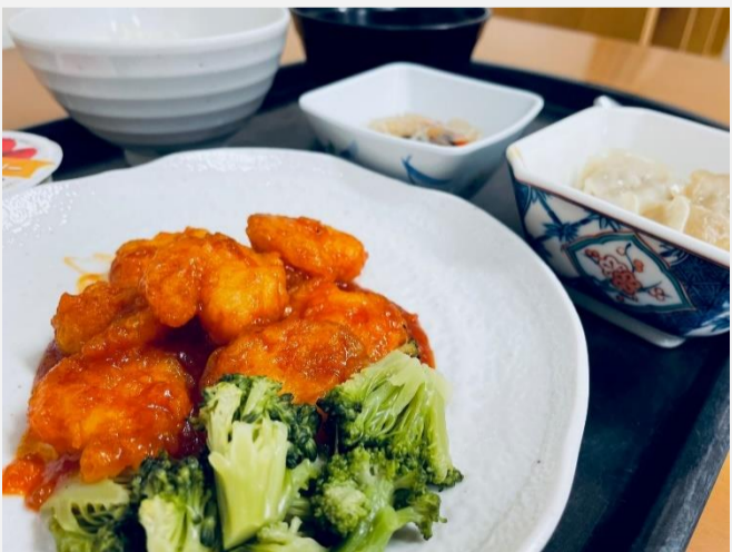
写真=スペシャルメニュー (2022年4月22日) マグロ漬けとネギトロの山かけ丼、香の物、揚げナスのそぼろ煮、うぐいす豆、すまし汁、ピーチフレッシュゼリー

などをされた後は女性職員に「どう？」などと聞かれる場面を多々お見受けいたします。理美容のスタッフの方が常に心掛けていることをお聞きすると「手早く※皆様を疲れさせないように」「キレイにセットしてあげたい」をモットーにされているとの事です。また注意していることは「刃物をつかうので取り扱いには十分注意しながらおこなう」「ケガのないように心がけている」と安全第一を最優先に意識されているという事です。ご高齢になると、身の回りのことがおろそかになりがちで、美容に対する意識も低下してしまう傾向があるそうです。しかし、美容を楽しめるようになると、気持ちが明るくなるなど精神面での良い影響も期待できます。状況に合わせて、車椅子に座った状態や、居室で行う事もできます。是非ご利用いただき明るい気持ちで毎日をお過ごし下さい。