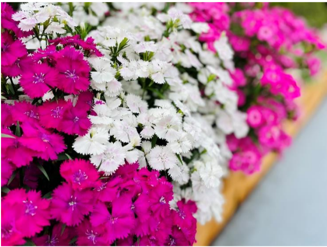
写真= 4F庭園のなでしこ (2022年5月6日)