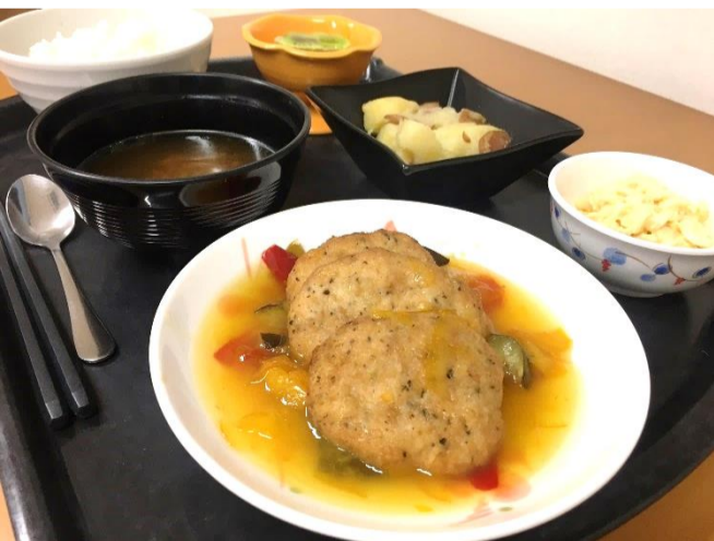
写真=2月のスペシャルメニュー 柔らかな若鳥のオレンジソース煮、マカロニ玉子サラダ、ジャーマンポテト、レアチーズのセルクルムース、オニオンスープ

幼かったとは言え、友達の家の人形のままごと遊びをした事が気になっていたのですが、元々は遊ぶための物だったと知って少しだけ安心しました。親御さんはどんな思いで見守ってくれていたのかわかりませんが、旧友には今更ながら感謝の思いです。