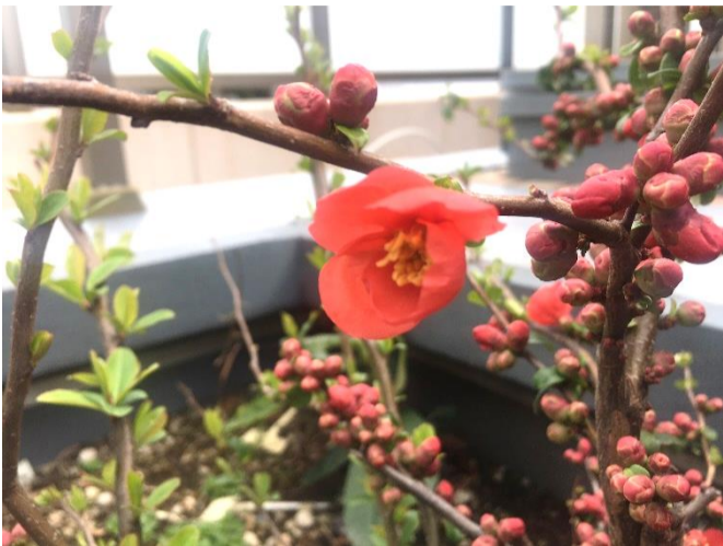
写真=4F庭園 ポケの花