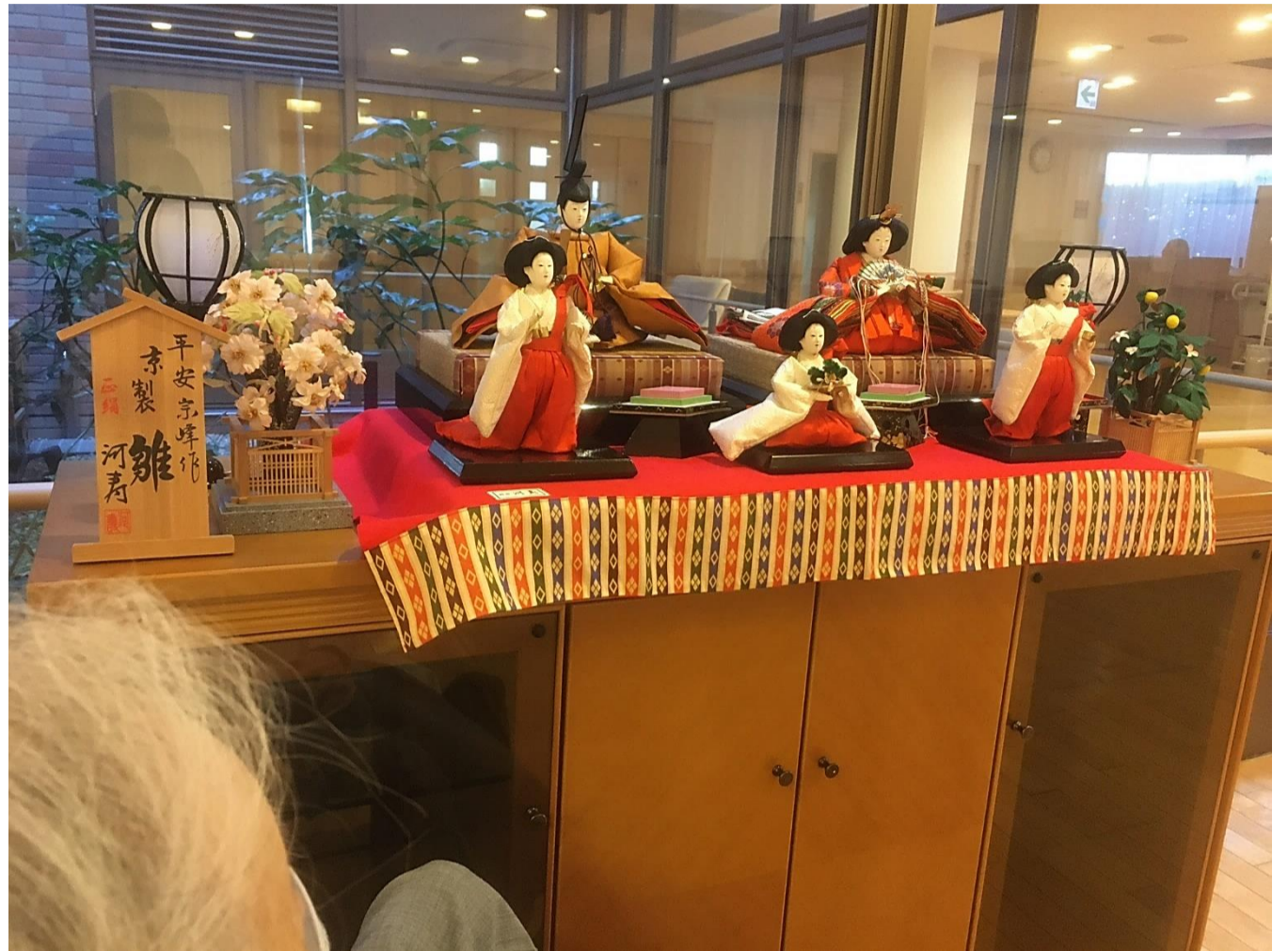
写真=1Fに飾られた雛人形 職員と入居者様と雛人形を見ている場面(2021年3月2日)