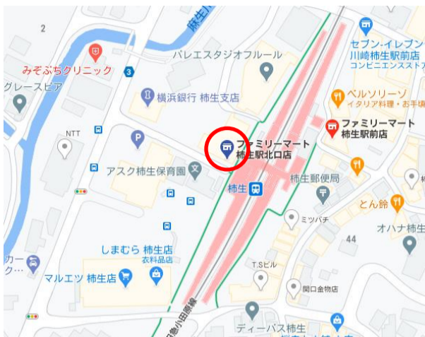
柿生駅北口ファミリーマート

中々、外出して買い物ができない中で、代行という形ではありますが、食事は皆様の楽しみの一つだと思いますので、生活の質を高められるように努力して参ります。