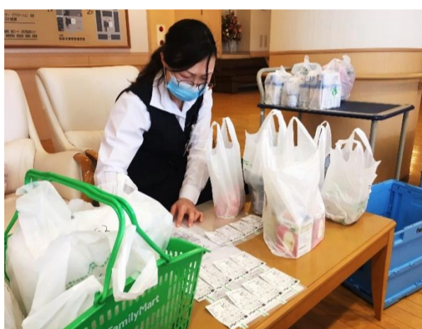
写真=2021年2月13日 買い物代行の納品時