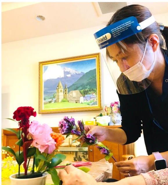
写真= 10月28日 フラワーアレンジメントの様子

あるご入居者様は「本当に綺麗な色ね」と見とれていらっしゃいました。こうしている間にも30分の時間はあっという間に過ぎてしまいます。出来上がったアレンジメントを見つめながら「来月の冬のお花はなんでしょうね」と期待を残して、10月のフラワーアレンジメントは終了となりました。