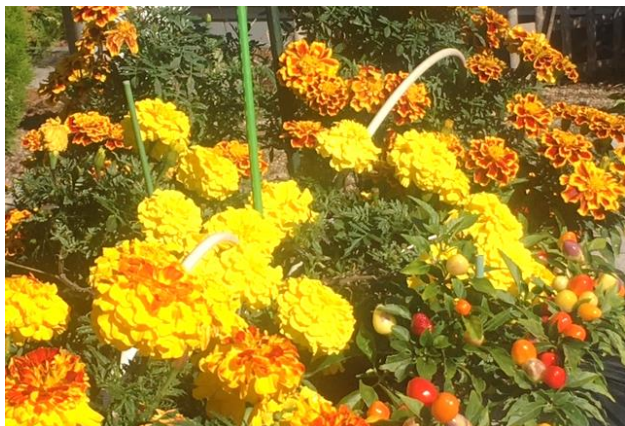
写真=4F庭園に咲いたマリーゴールド