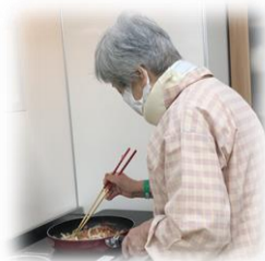
☆完成した焼きそば☆