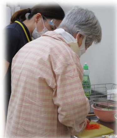
「包丁で食材を切る」